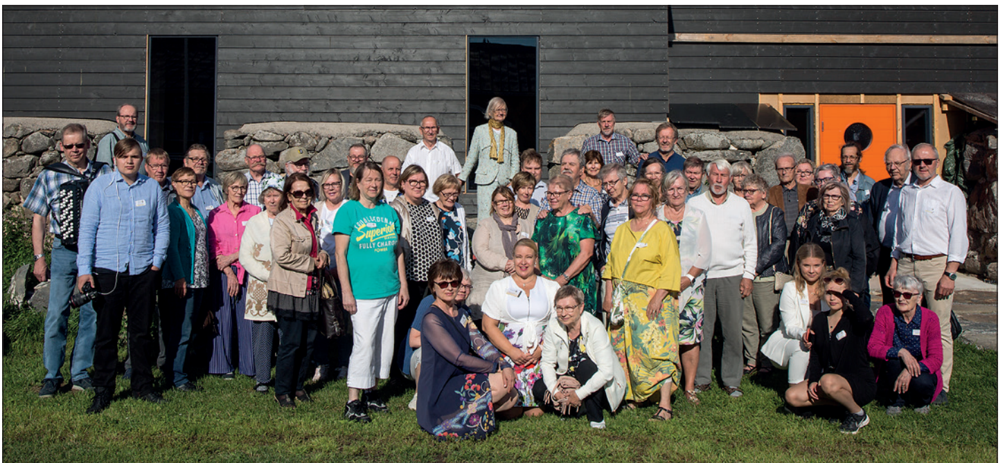
Jäppilän Heinäselän uudistetun navettarakennuksen edustalla otettu ryhmäkuva.